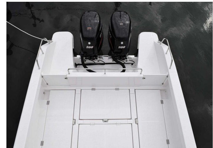
フラットなスターンデッキ/後部一体型のトランサムステップ