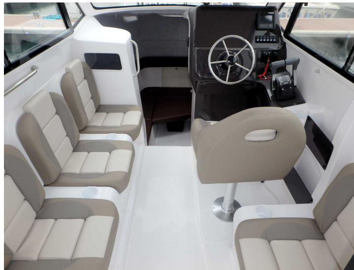
キャビン内：天井高と開放感があるゆとりあるスペースを実現