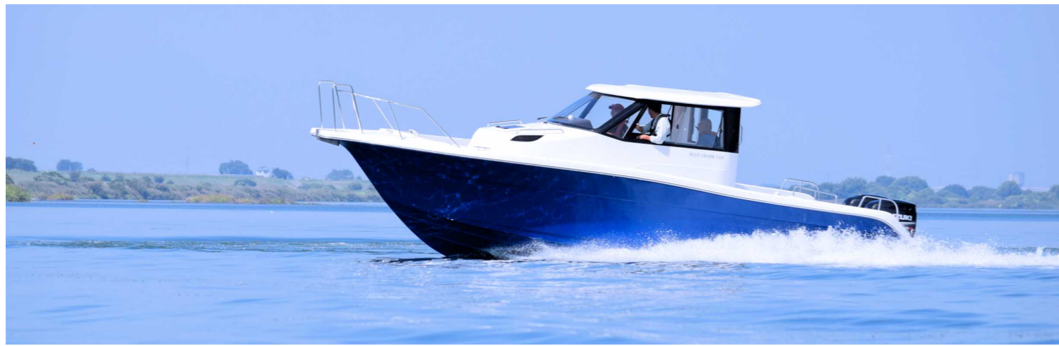
抜群の走行性と安定感