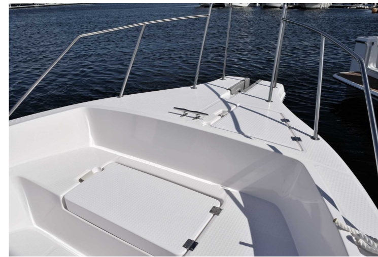
安全を考慮したパウレール