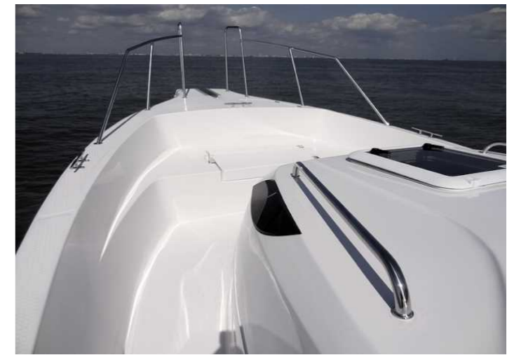
ウォークアラウンドタイプの広いパウデッキ