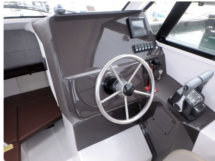
コックピット：大型GPS魚探も埋め込み設置可能